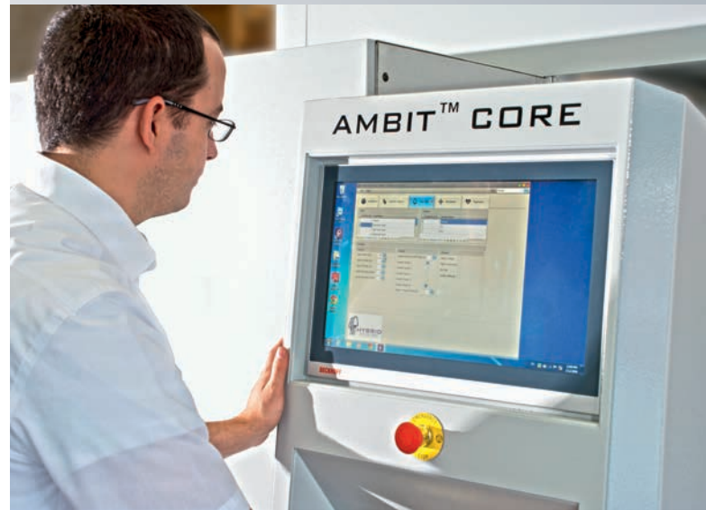
Die Steuerung der Anlage erfolgt am Beckhoff Multitouch-Panel-PC CP2218.