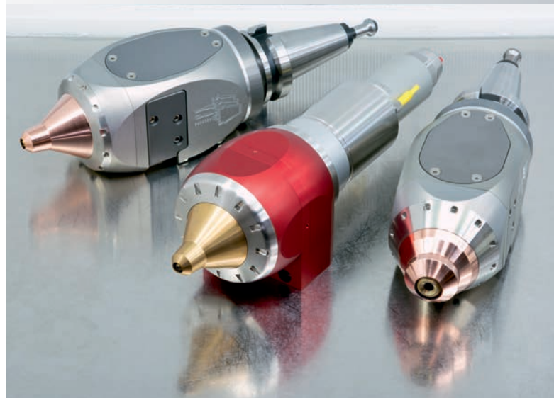
Das Hybrid-System unterstützt eine große Bandbreite an Bearbeitungsköpfen mit verschiedenen Geometrien, Laserprofilen, Pulverbereitstellungskonfigurationen und unfokussierten Strahlen.