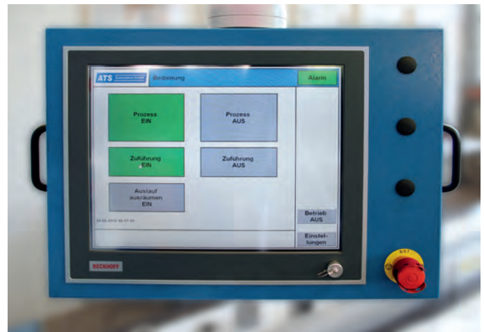
Der 19-Zoll-Touchscreen des Einbau-Panel-PCs CP6203 bietet ausreichend Fläche für eine übersichtliche Darstellung der mit TwinCAT HMI erstellten Visualisierung.

Als Lohnfertiger in der Metallverarbeitung prüfte Brüggli Industrie die hergestellten Stanzteile bislang mit einer Sichtprüfung. Um die Qualitätssicherung zu verbessern und die Durchlaufzeiten zu reduzieren, wurde diese durch eine vollautomatische, bildverarbeitungsgestützte Prüfzelle von ATS ersetzt. PC-Control von Beckhoff sorgt dabei als integriertes Steuerungssystem für präzise Prüfabläufe und ein dynamisches Teile-Handling per Delta-Roboter.