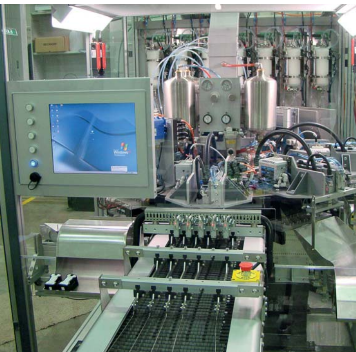
Ausgangsförderer und Tintenverarbeitungsantriebsplattform