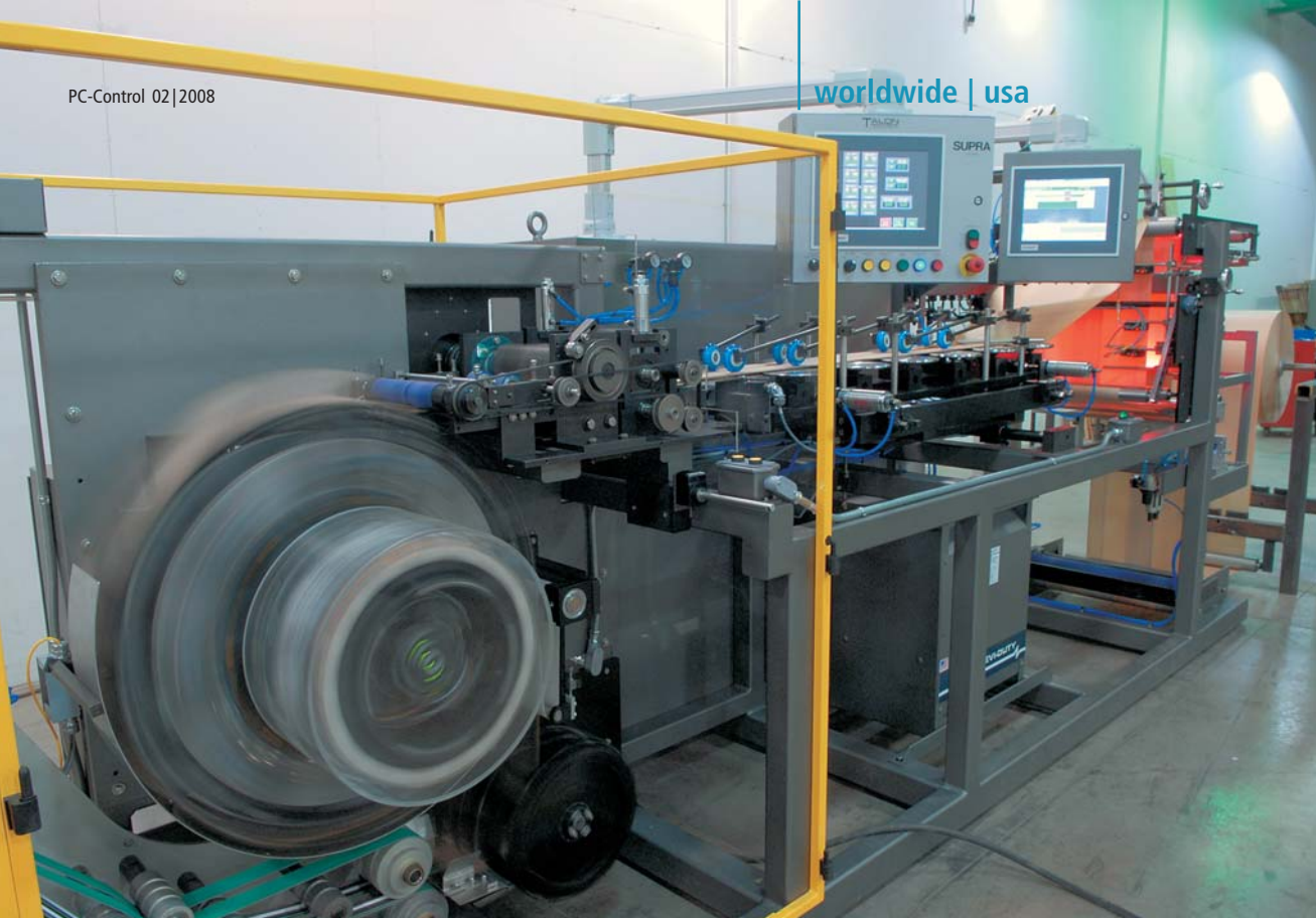
Die PC-basierte Steuerung erlaubt ein Höchstmaß an Präzision: Die Popcornrütten haben präzisere Schnitte und eine einheitliche Länge.

men Leistungsfähigkeit ist EtherCAT billiger als die meisten herkömmlichen I/O-Systeme, da Standard-Ethernet-Komponenten und -Verkabelungen eingesetzt wurden“, so Hohn. „Die Vermeidung teurer Feldbuskarten und der noch kostspieligeren Feldbusverkabelung tragen entscheidend zur Kostenreduktion und damit zur Erhöhung der Wettbewerbsfähigkeit unserer Maschinen bei.“